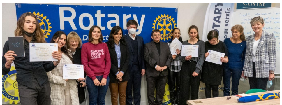
Félicitations à tous les participants !