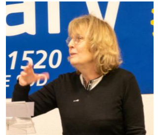
La présidente du jury

Des huit lycéens initialement inscrits, trois n'ont pu être présents en raison de leur contamination par le Covid-19, et ce sont donc cinq candidats issus de trois lycées de la métropole (Faidherbe et Fénélon à Lille et Jehanne d'Arc à Tourcoing) qui ont participé à ce quart de finale.