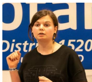
Des candidats convainquants