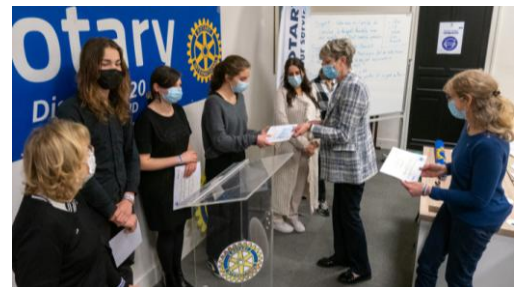
La remise des prix aux candidats