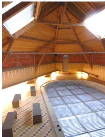
La piscine du Familistère de Guise

La raison en est que, abstraction faite de ses outrances et de ses divagations, Charles Fourier a été le précurseur de conceptions généreuses et, pour certaines, toujours d'actualité. Il a notamment défendu l'idée, inimaginable à son époque, de l'égalité absolue hommes/femmes. Fourier ne comprenait pas que les femmes soient écartées de l'Université, de la magistrature, des carrières médicales. Il a également plaidé pour la reconnaissance de la dignité des ouvriers, avant même que ceux-ci aient clairement conscience de constituer une classe. Et il a proclamé que c'était un devoir de fournir aux ouvriers un logement décent, ce que Jean-Baptiste Godin a réalisé dans son Familistère à Guise. Il a établi les fondements du concept de médecine préventive. Il a, enfin, inlassablement pris position en faveur de l'accès de tous à la culture, à l'art, aux loisirs. Sur ce point encore, il fut entendu et suivi par Godin, puisque l'on trouve, autour du Palais social de Guise, un théâtre, une piscine, une bibliothèque, des jardins, qui font partie intégrante du Familistère.