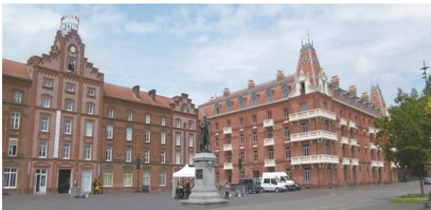
Le familistère de Guise , œuvre de Jean-Baptiste Godin, partiellement inspiré du concept du phalanstère de Fourier

Fourier avait, en effet, le sentiment d'avoir fait des découvertes capitales. Il affirmait que le principe d'attraction, qu'il avait emprunté à Newton, régissait le monde social à l'instar du monde physique.